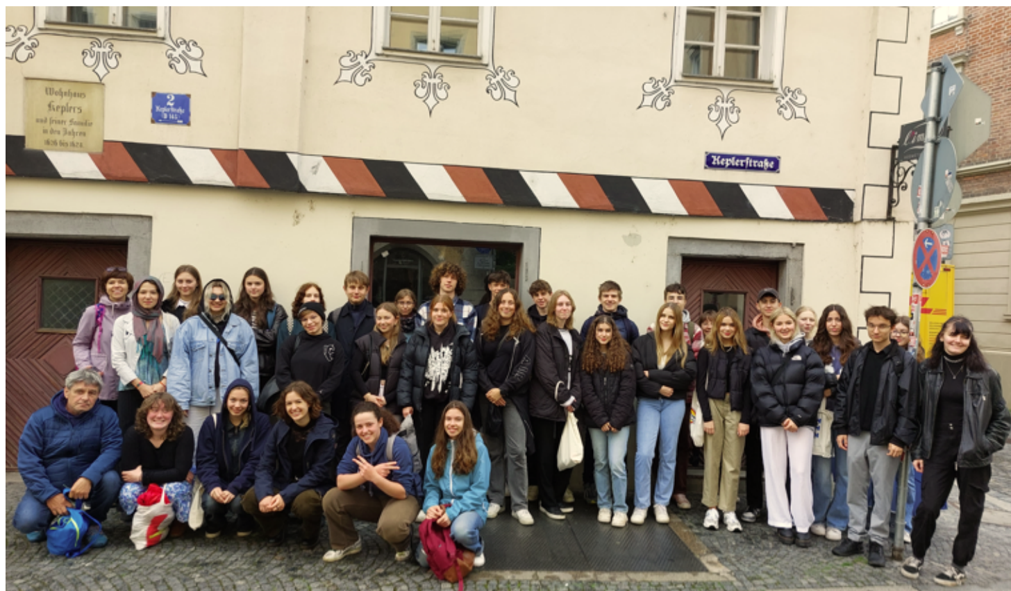
My všichni před Keplerovým domem v Keplerově ulici.