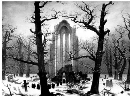
Caspar David Friedrich (1774-1840)