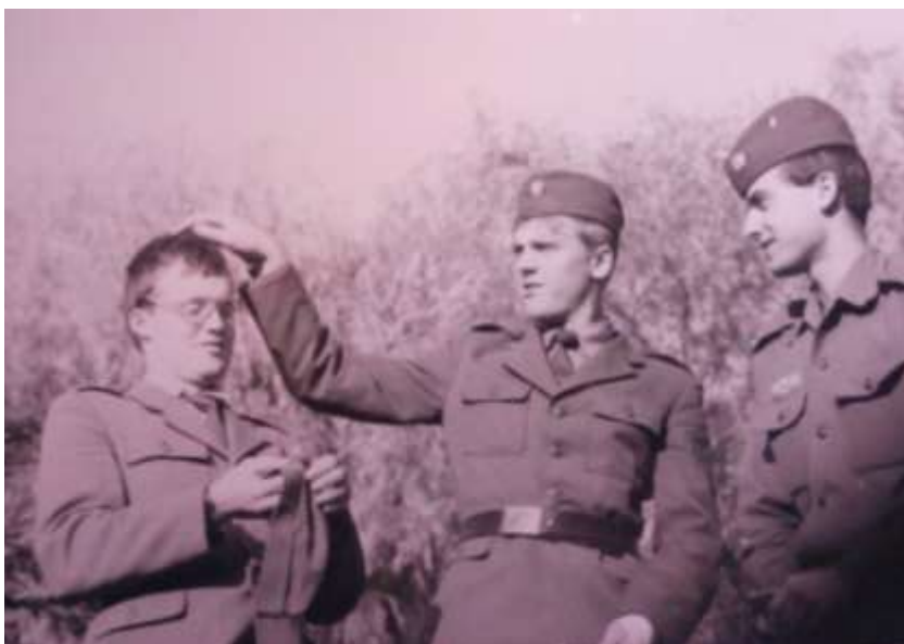
Obrázek č. 3: Vojáci ročníku 1981 až 1983 z VÚ 1745 Bor u Tachova posílali toto oznámení svým kamarádům, aby se informovali o svém brzkém návratu. 40