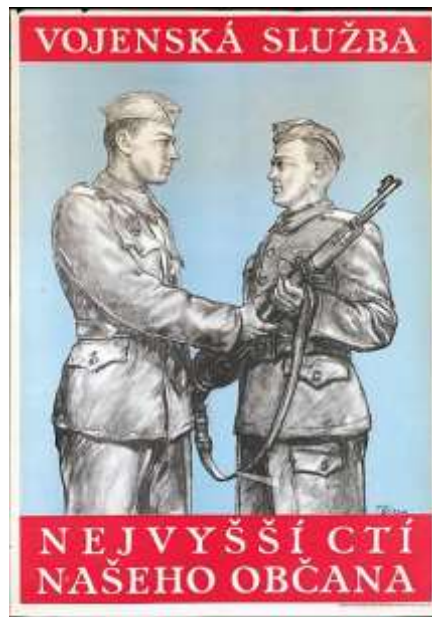
Obrázek č. 9: Propagandistický plakát za socialistického Československa 46