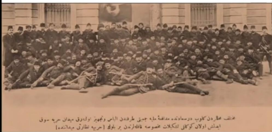
č.1. Členové Teškilát-i Mahsusi vyfoceni před ministerstvem války.